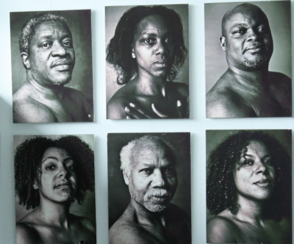
Exposition : « C'est pas marqué sur mon front »